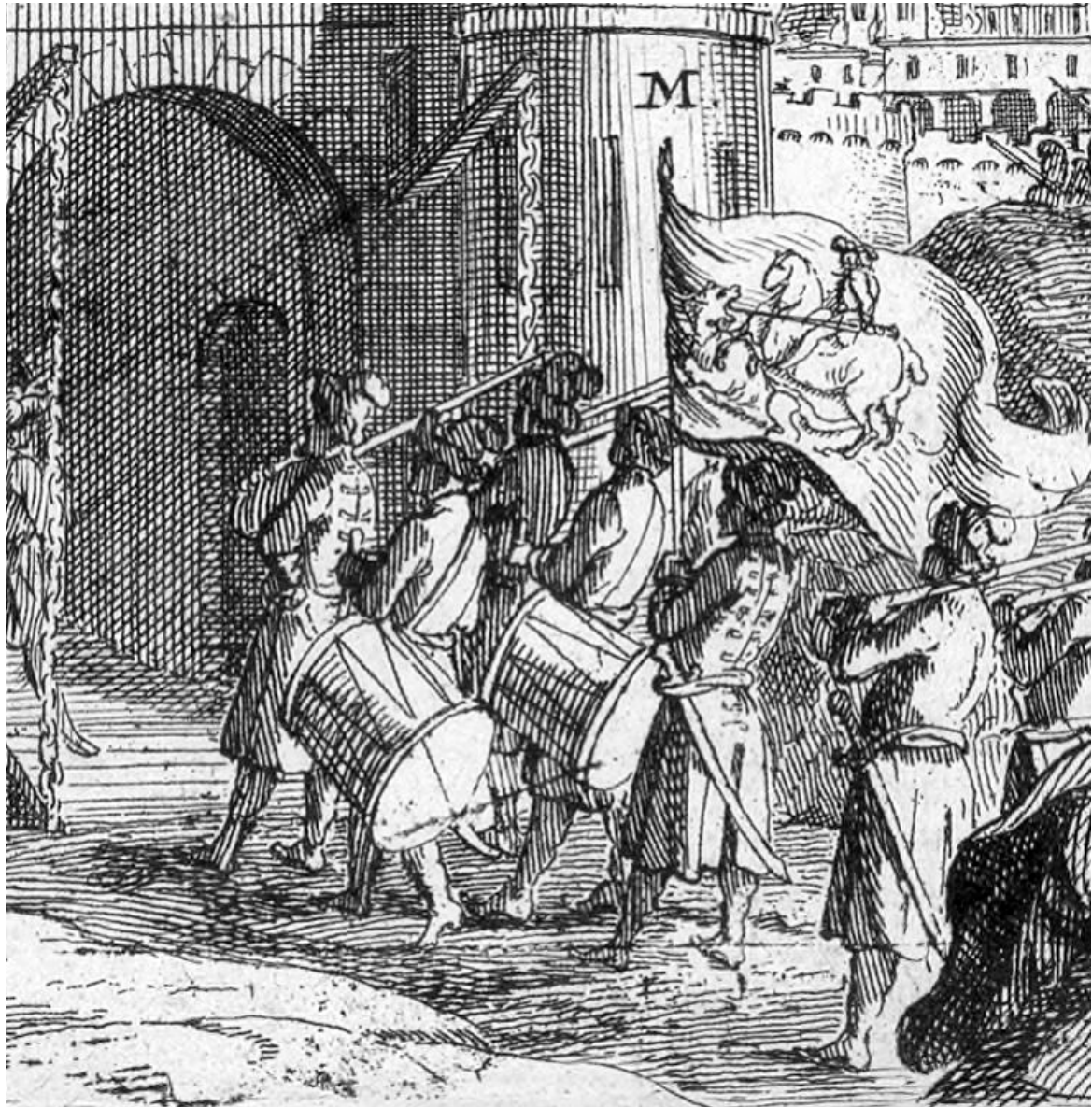
სურ. 6 ქართველთა შესვლა იერუსალიმში გაშლილი დროშით, რომელზეც გამოსახულია წმინდა გიორგი (ფრაგმენტი)