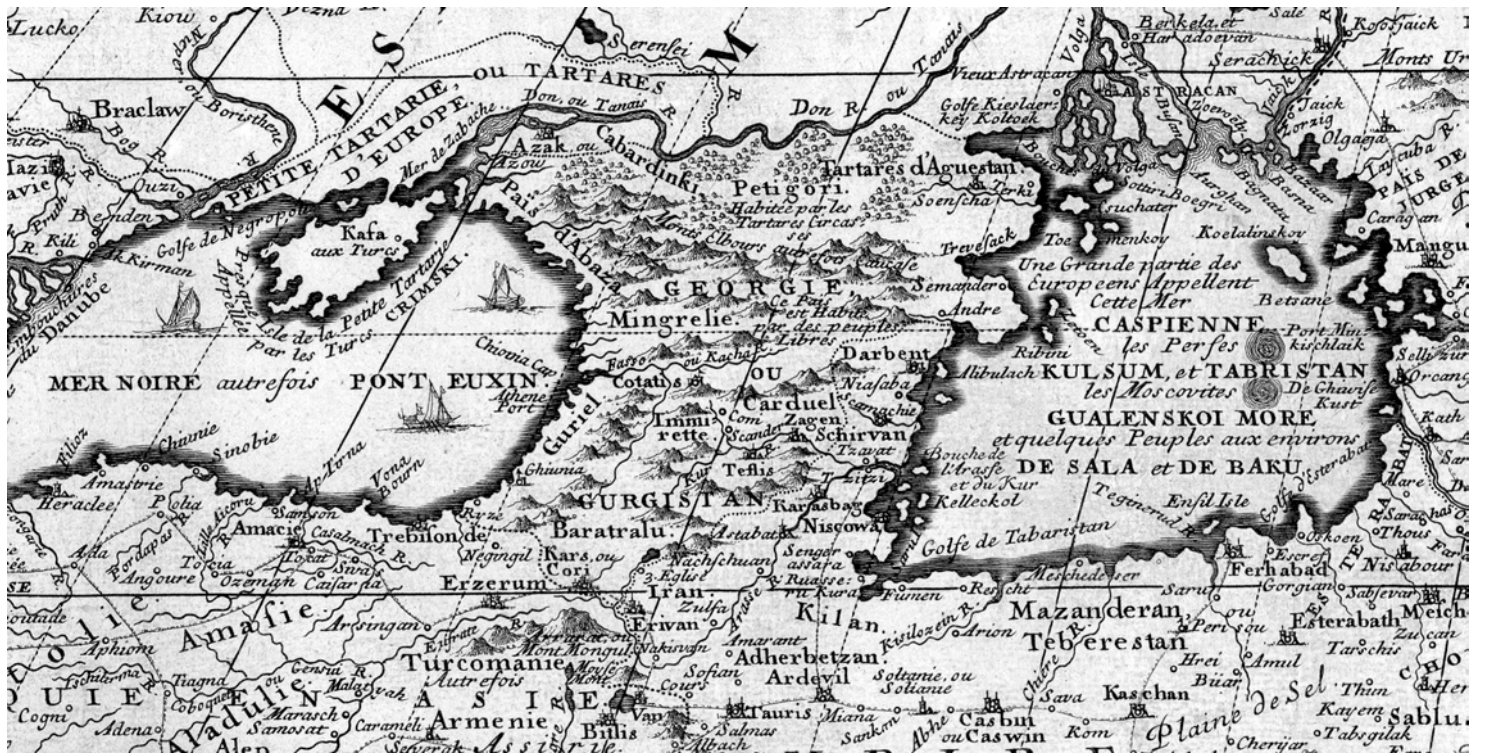
სურ. 2 საქართველო ნიკოლა დე ფერის აზიის რუკაზე (ფრაგმენტი)