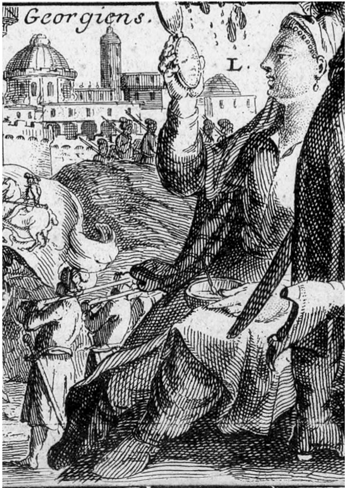
სურ. 5 ქართველი ქალი - გრავიურა ნიკოლა დე ფერის აზიის რუკაზე (ფრაგმენტი)